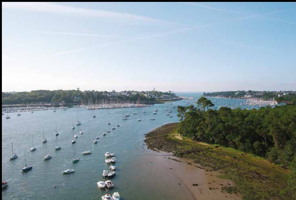
Embouchure du fleuve côtier Odet (Bénodet, rive gauche pays de Fouesnant, et Sainte-Marine, rive droite pays bigouden) à 18 km de Quimper.