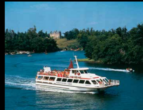
Volette de l'Odet et Château de Keranbleiz