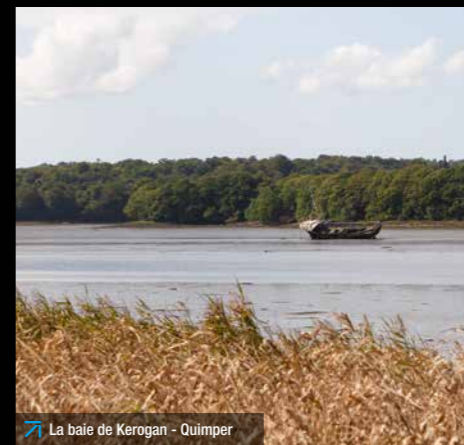
La baie de Kérogan - Quimper

Sur les cirés, les larmes noires avaient disparu et ils purent entendre un dernier « trugarez » (merci, en breton) avant de voir le bateau s'évanouir dans la nuit.