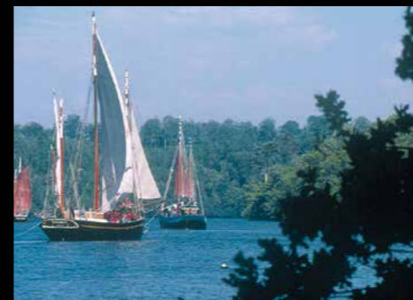
Le Corentin, Lougre de l'Odet