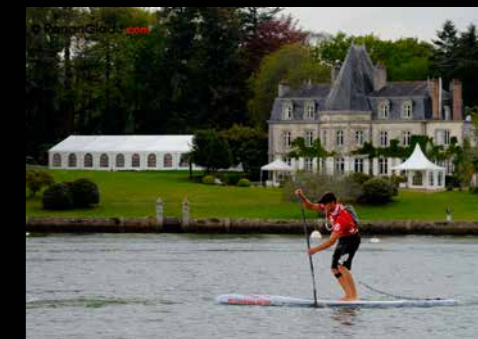
Stand Up Paddle et manoir de Kerouzien