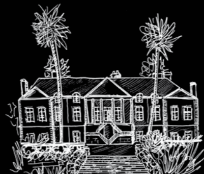
Château de Lanniron

• Plus loin sur les rives de l'Odet, autour d'un étang le parc de loisirs de Creach-Gwen propose, promenades au bord de l'eau, parcours santé, bateaux miniatures, canoë, kayak, voile, skate-parc, accro branches, jeux pour petits, et aire de pique-nique. Ce bel espace naturel est un des charmes de ce lieu appelé BAIE DE KEROGAN .