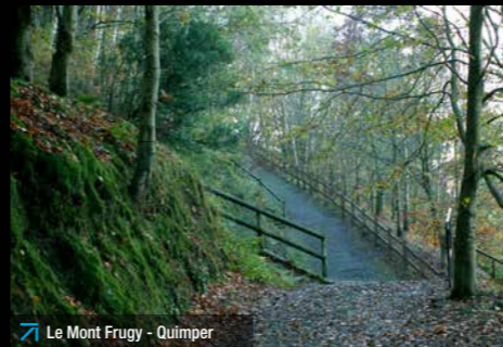
Le Mont Frugy - Quimper