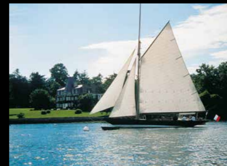
Pen Duick et manoir de Kerouzien