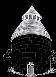
Colombier de Lestremeur

Nous quittons le pays de Quimper, pays Glazik , pour entrer dans les pays bigouden et fouesnantais, qui rive droite et rive gauche se font face jusqu'à la magnifique embouchure.