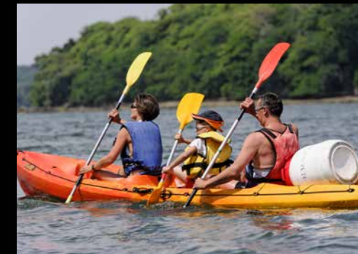
Canoe-kayak base nautique de Creac'h Gwen