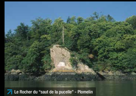
Le Rocher du "saut de la pucelle" - Plomelin