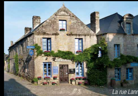
La rue Lann

A l'entrée de la rue se trouve l'ancienne demeure du Prieur, le responsable de la petite communauté de bénédictins installée près de l'Eglise. Les armoiries surmontant la porte en accolade en garde le souvenir. C'était également la maison familiale d'Yves Tanguy (peintre surréaliste Breton, 1900-1955), grand ami de Salvador Dalí et de Jacques Prévert. Il y invita également Max Jacob, André Breton, Pierre Prévert. Yves Tanguy passa de nombreuses vacances dans cette maison familiale qui vont le marquer tout au long de sa carrière, y puisant son inspiration, que se soit des paysages ou des légendes bretonnes.