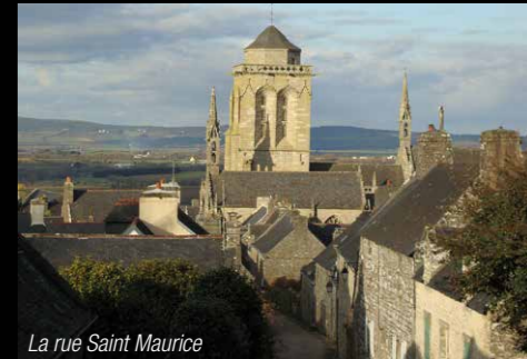
La rue Saint Maurice

Cette rue est une ancienne voie romaine permettant d'accéder à Quimper. De nombreuses maisons anciennes portent encore les dates de 1681, 1730, 1794, 1741... En haut de la rue, on peut voir une magnifique vue sur l'Eglise et les toits de la ville, qui inspira de nombreux peintres (notamment Maxime Maufra 1861-1918, Mathurin Méheut 1882-1958, Yvonne Jean-Haffen 1895-1993).