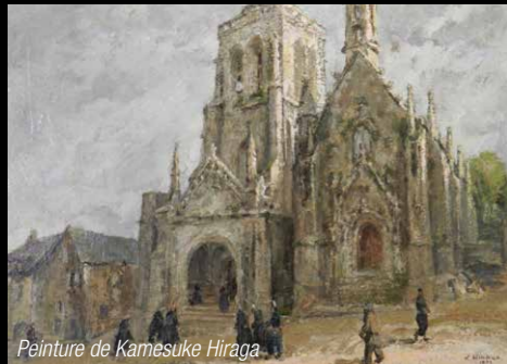
Peinture de Kamesuke Hiraga

Le musée propose également une collection de peintures bretonnes, gravures, faïences... Lieu d'inspiration pour nombre d'artistes, cette étape de la Route des Peintres en Cornouaille, témoin de la richesse artistique en Bretagne au début du 20 ème siècle.