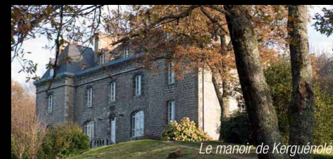
Le manoir de Kerguénoles

Le manoir est l'ancienne demeure de Charles Daniélou (homme politique, poète et romancier 1878-1953), élu maire de Locronan en 1912, puis pendant plus de trente ans. Député du Finistère et plusieurs fois ministre sous la 3 ème République, Charles Daniélou déploiera toute son énergie à la conservation et au classement des monuments historiques, en défendant notamment un projet de loi sur leur protection, prélu à la loi de 1913. Sous son essor, l'ensemble des maisons de la place de l'église fut classé dans les années 20-30.