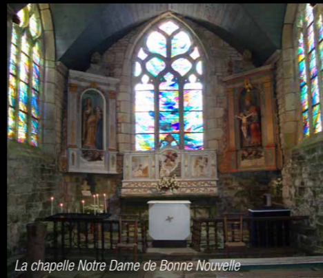
La chapelle Notre Dame de Bonne Nouvelle

C'était le point d'eau du quartier, d'où l'usure des pierres tout autour.