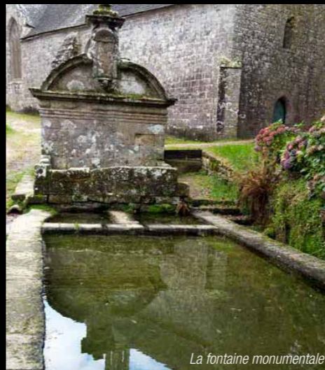
La fontaine monumentale