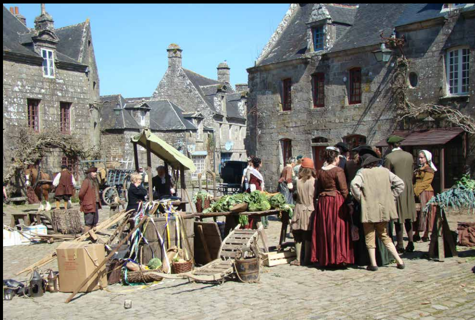
Locronan, véritable décors de cinéma. Tournage de la série « L'épervier »