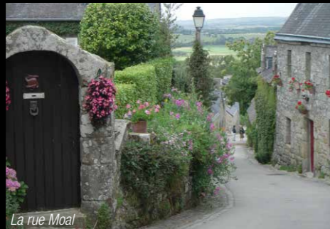
La rue Moal