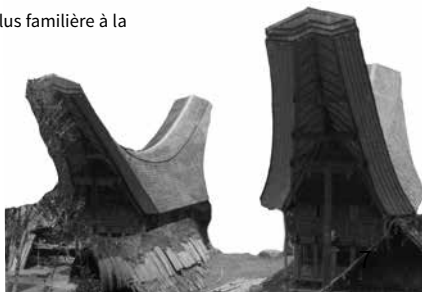
Habitations Torajas, sur l'île des Célèbes - Indonésie