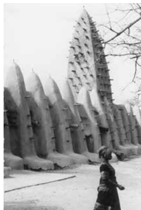
Ancienne mosquée bobo, Burkina Faso

Hede a photographié le monde, rendant compte de sa diversité naturelle, humaine et culturelle. L'architecture, très présente dans ses reportages, est une expression de cette formidable diversité. On s'émerveille devant la grande variété de formes et d'usages dont résultent les constructions architecturales photographiées par Othony Hede, de la plus traditionnelle à la plus moderne, de la plus modeste à la plus fastueuse, de la plus familière à la plus surprenante.