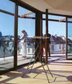
Centre des Congrès du Chapeau Rouge, Quimper