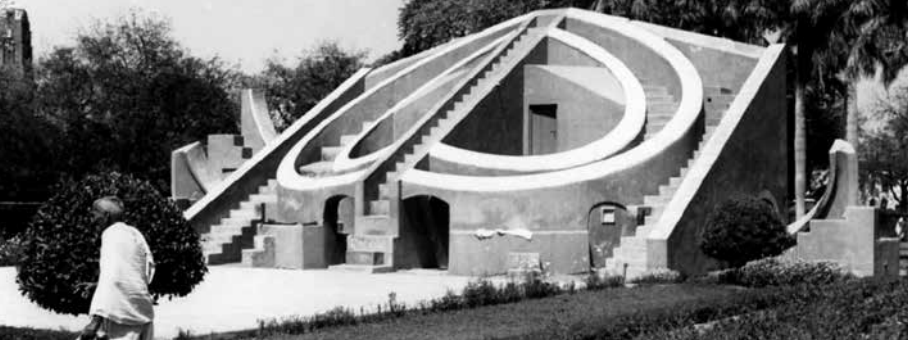
Observatoire Yantra Mandir à Delhi - Inde