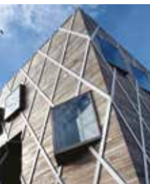
Maison des services publics à Kermoyan, Quimper

Le Printemps de l'architecture est une saison culturelle en Finistère qui propose de découvrir autrement l'architecture qui nous entoure. Des animations sont programmées par la Maison du patrimoine dans le cadre de cette manifestation.